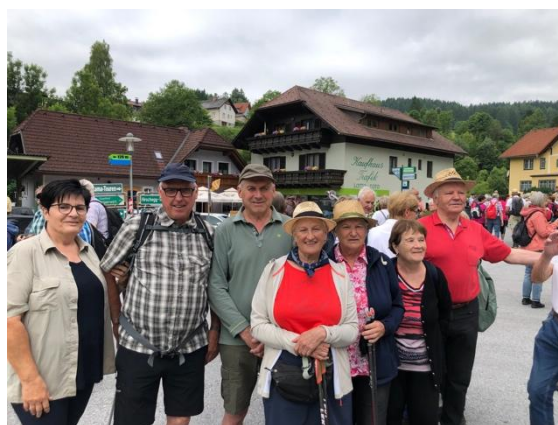
Die Wanderer in Hirscheegg

Ein sehr bewegtes Vereinsjahr 2025 geht zu Ende.