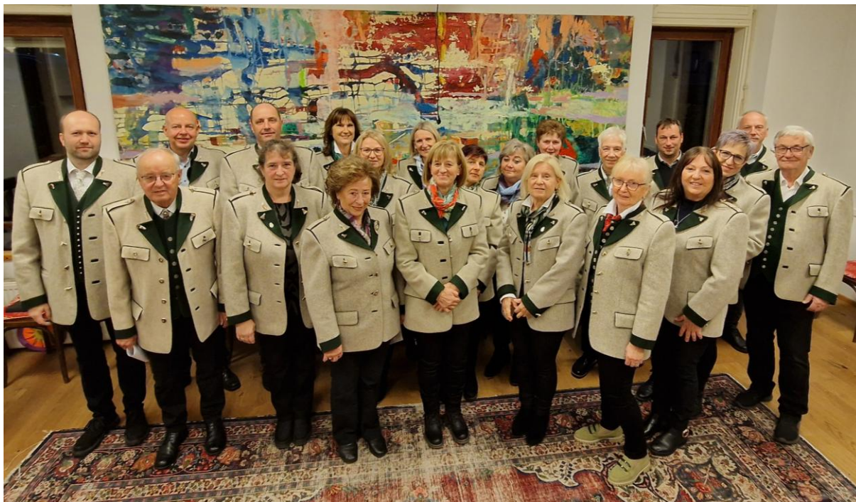
Der Singkreis Hirschegg beim Bezirkssingen 2025