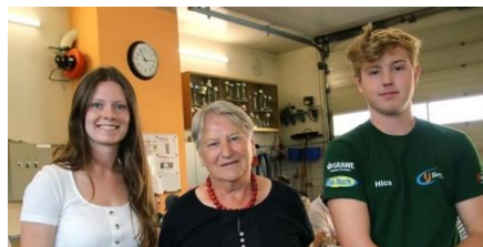
Unsere Obfrau mit der Landjugend