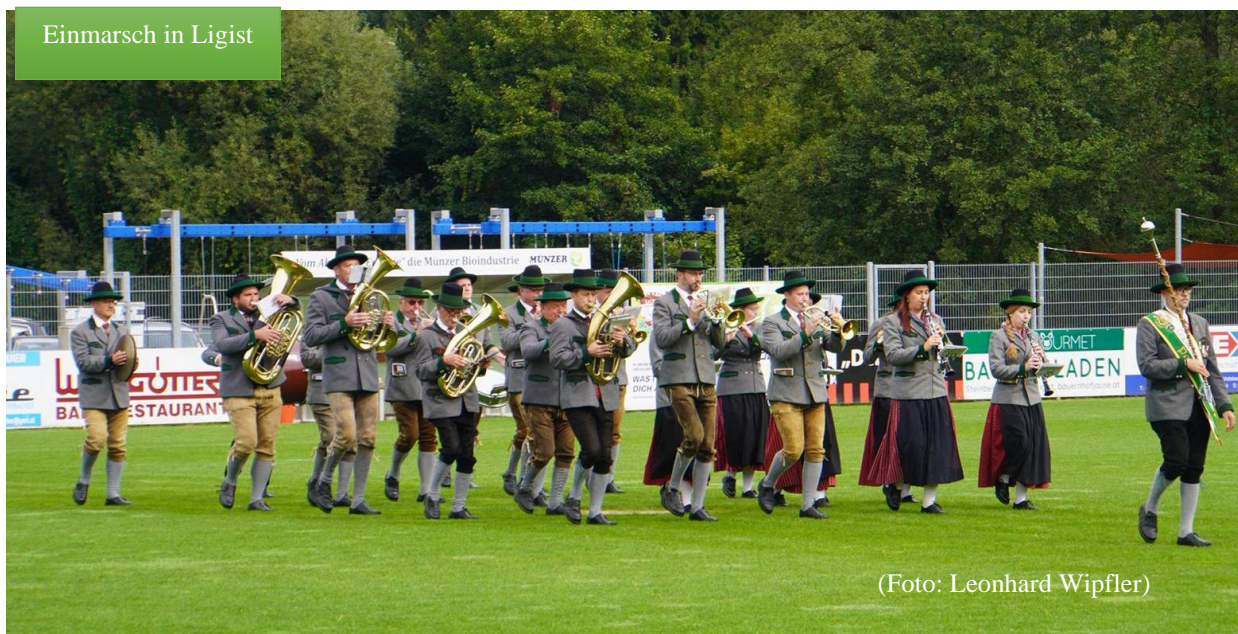
Einmarsch in Ligist