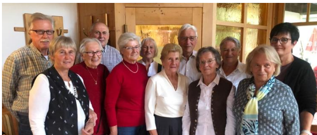
Die Geburtstagsjubilare mit dem Vorstand