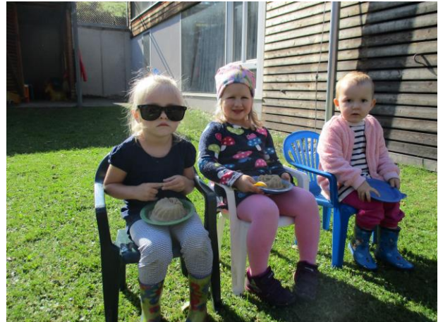
Einfach in der Sonne sitzen und die Seele baumeln lassen.