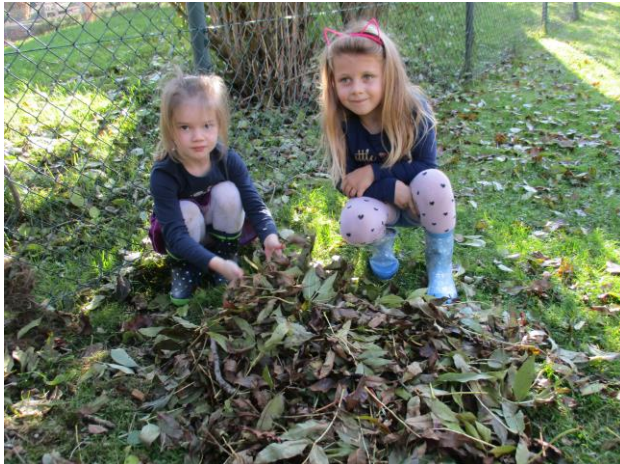
Ein Laubhaufen wird für den Igel gebaut.