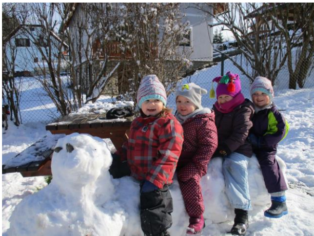
Spaß im Schnee, Nov. 2018