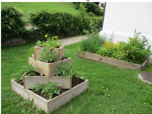
Hochbeet und Kartoffelpyramide: Es wächst und gedeiht!