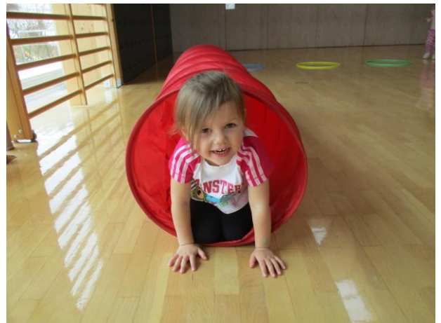
Auch im Turnsaal gibt es jede Menge Spaß.